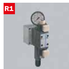
Reg. pressione morse Adjustable vice pressure