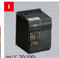
Inverter Frequency converter (m/1' 20-100)