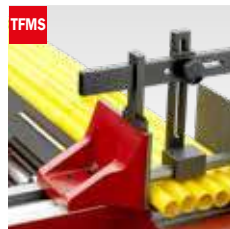
Taglio fascio meccanico Mechanical bundle clamping device